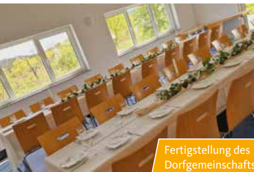
Fertigstellung des Dorfgemeinschaftshauses in Lohrsdorf