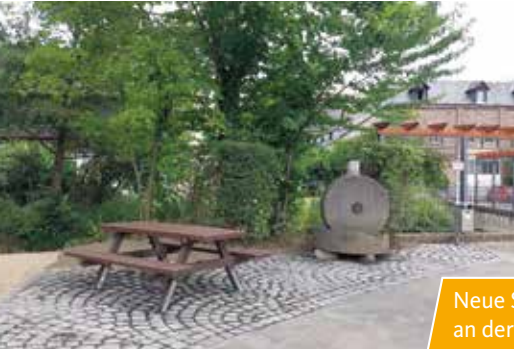
Neue Sitzgruppe in Green, an der alten Mühle