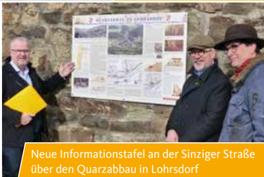
Neue Informationstafel an der Sinziger Straße über den Quarzabbau in Lohrsdorf