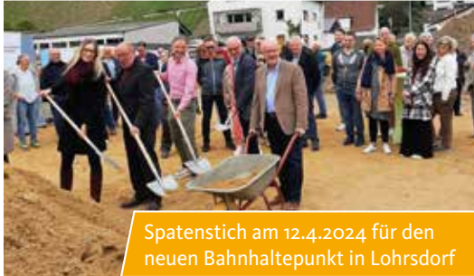
Spatenstich am 12.4.2024 für den neuen Bahnhofsteppunkt in Lohrsdorf